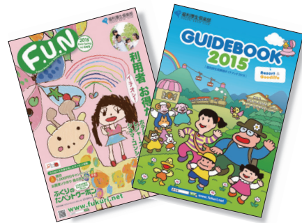
季節会報誌・ガイドブックイメージ▲

四季折々のオリジナル企画やキャンペーン情報満載の季節会報誌(年6回発行)や、保養所から介護サービスまで、全サービスを載せた「ガイドブック」(年1回発行)で豊富な情報を届けます。さらに、インターネット、FAXでもタイムリーで、詳しい情報を提供します。